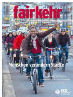
Titelbild "fairkehr" 3/2014

07.06.2014 | Samstag | Kolumne fairkehr 3/2014