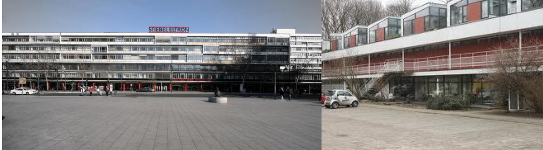
Bikinihaus Budapester Str.